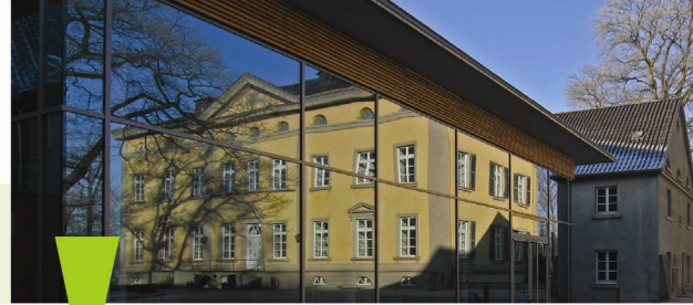
Evangelische Kirche von Westfalen

Tagungsort: Evangelische Jugendbildungsstätte Nordwalde Bispingallee 15, 48356 Nordwalde Telefon: 02573 9363-0 Telefax: 02573 9363-25 Die am Ortsrand von Nordwalde gelegene Jugendbildungsstätte können Sie mit Bahn, Bus und Auto günstig erreichen.