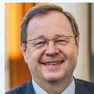
Bischof Dr. Georg Bätzing Vorsitzender der Deutschen Bischöfskonferenz

Lassen Sie uns miteinander die vor unserer Gesellschaft liegenden Aufgaben annehmen und anpacken, um so unser Zusammenleben in Freiheit und Demokratie unter sich immer wieder verändernden Rahmenbedingungen zu festigen und zu gestalten.