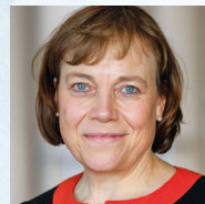
Präses Annette Kurschus Vorsitzende des Rates der Evangelischen Kirche in Deutschland